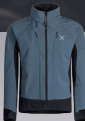
Challenge 2 Jacke Herren robuste Soft- shelljacke € 278,95