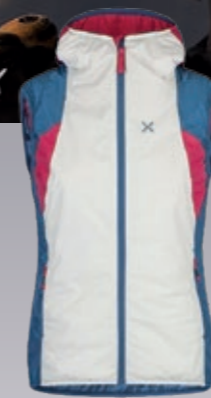
Trident Weste Damen warme Kunstdaunen- weste € 198,95