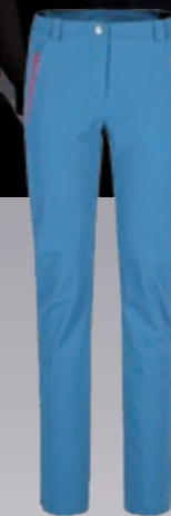
Vajolet Hose Damen elastische Outdoorhose € 158,95