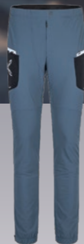
Ski Style Hosen Herren funktionelle Tourenhose € 158,95