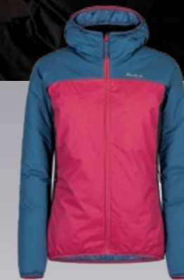
Outback Hoody Jacke Damen warme Kunst- daunenjacke € 238,95