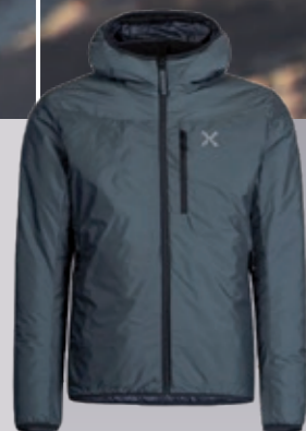
Outback Hoody Jacke Herren warme Kunst- daunenjacke € 238,95