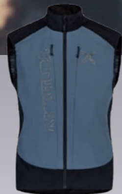
Ski Crossing Weste Herren schützende Softshellweste € 148,95