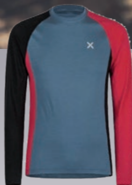
Merino Neck Maglia Herren weiches Merinoshirt € 114,95