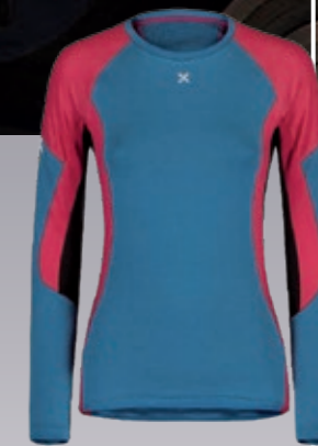
Run Fly Maglia Damen funktionelles Polartec Shirt € 108,95