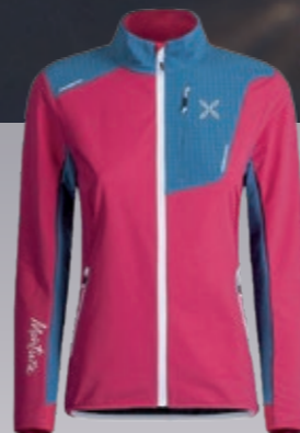
Ski Style Jacke Damen wind- abweisende Fleecejacke € 178,95